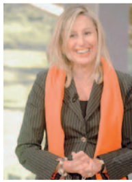
Gabriella Alemanno, direttrice dell'Agenzia del territorio

NAPOLI — Una regione di «immobili fantasma», come li definisce l'Agenzia del territorio. In base al consuntivo, appena presentato e aggiornato al 30 aprile, dell'attività di regolarizzazione dei fabbricati mai dichiarati al Catasto o che hanno subito variazioni non dichiarate. Certamente fuori regola, quindi, ma non necessariamente abusive. In Campania, infatti, le «case fantasma» sono complessivamente 295.470: soltanto in Sicilia sono più numerose, e cioè 307.249. Tra le province, «vince» di gran lunga Salerno, che arriva a quota 105.228 ed è anche la prima d'Italia in questa classifica dell'irregolarità. Seguono nell'ordine Napoli con poco meno di 60 mila, Avellino con oltre 55 mila, Caserta con 41.361 e Benevento con quasi 34 mila.